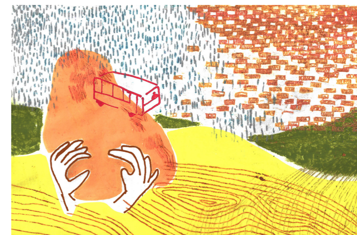
L'école hors-les-murs, ou l'expérience du milieu

Inutile de détailler l'urgence écologique, ni toutes les raisons qu'il y a d'agir. Il y a cependant lieu d'insister que protéger l'environnement — par des solutions qui ne cherchent qu'à retarder ou estomper l'exploitation de la nature — ne suffira pas. « L'action écologique est fondamentalement une action sociale. » [Bookchin] Quelle révolution écologique sociale par les communes ? Comment défendre une écologie radicale au sein d'institutions existantes ? De l'action à la politique, de la théorie aux mains dans la terre et dans le terroir, comment construire collectivement un municipalisme écosystémique à l'épreuve du néant ?