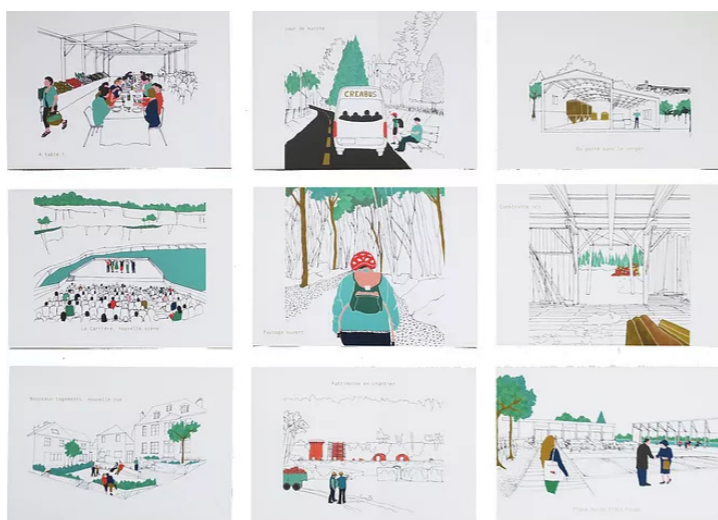
Résidence d'architecture [Meat architectures et territoires]